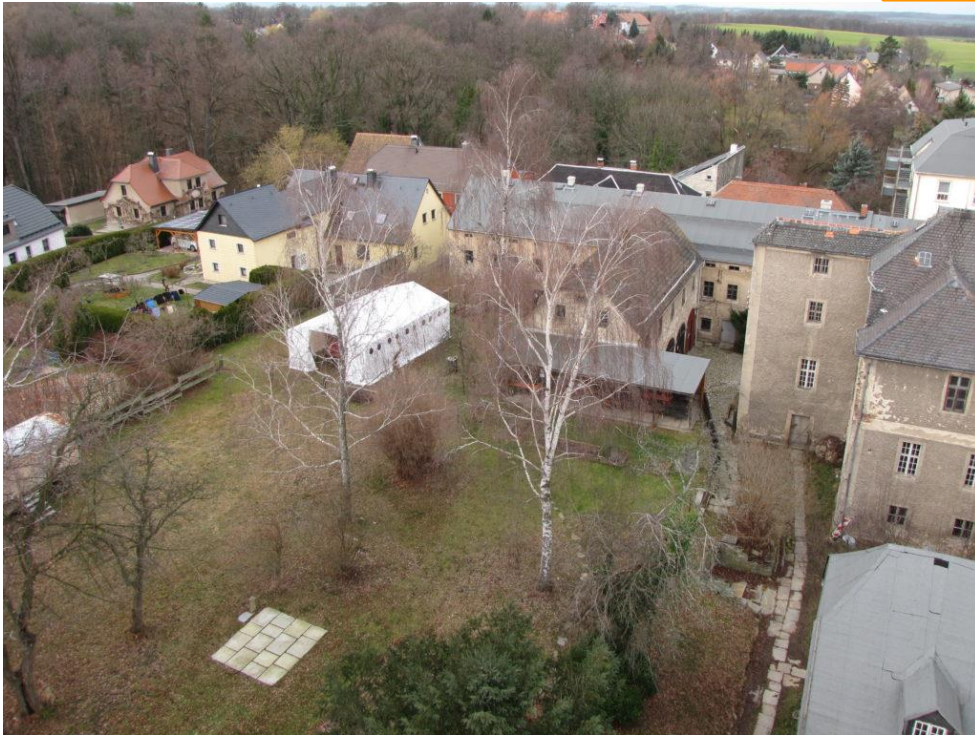
Abbildung 3: Blick auf den Garten der Schwesternhäuser aus www.schwesternhaeuser-kleinwelka-ev.org